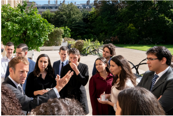
Échange avec la jeunesse sur les questions mémorielles liées à la colonisation et à la guerre d'Algérie 30 septembre 2021

La commission a également engagé plusieurs chantiers de temps long. Il s'agit notamment du futur musée de l'Histoire de France et de l'Algérie, qui devrait ouvrir ses portes à Montpellier. De même, un premier appel à candidatures a été lancé en mars 2022 pour des résidences d'artistes algériens en France sur trois ans. Enfin, l'Office National des Anciens Combattants et Victimes de Guerre qui porte depuis plusieurs années une offre de projets pédagogiques vers l'Éducation nationale autour d'un kit documentaire, de formations pour les enseignants et de séances de témoignages «à quatre voix», prévoit de développer son offre. Collégiens et lycéens pourront ainsi mieux comprendre cette histoire, les motivations des différents parcours, et se rendre compte que les anciens Harkis, indépendantistes, appelés et pieds-noirs peuvent, aujourd'hui, raconter ensemble leur histoire.