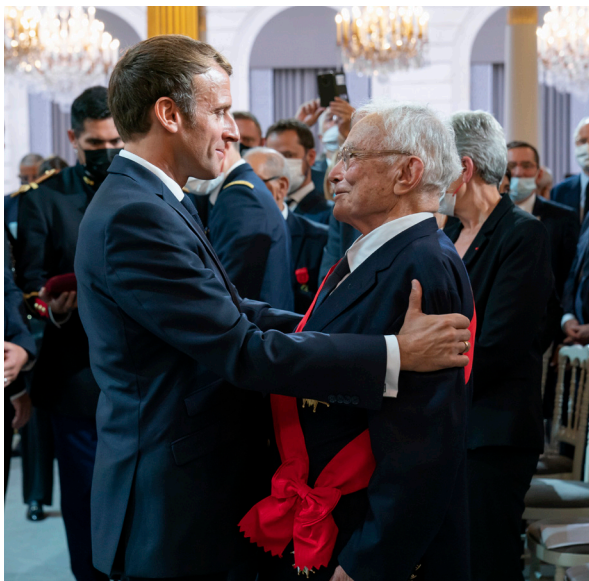
Réception à l'Élysée en l'honneur des Harkis 20 septembre 2021

Dans son discours, il a tenu à reconnaître la singularité de l'histoire des Harkis, marquée par les manquements de l'administration française au respect de la dignité et l'intégrité des personnes, ainsi qu'envers elle-même et ses propres valeurs. Le président de la République a reconnu une dette de l'État français et a demandé pardon aux Harkis et à leurs enfants. Le 25 janvier 2022, après l'Assemblée nationale, le Sénat a adopté un projet de loi de reconnaissance et de réparation pour les Harkis. La loi a été définitivement adoptée puis promulguée le 23 février 2022. Une commission indépendante présidée par M. Jean-Marie Bockel a ainsi été établie pour mettre en œuvre le dispositif de reconnaissance et de réparation. Elle poursuit depuis son travail par des visites dans les anciens camps d'accueil, des rencontres avec les associations, la mise à disposition d'information sur le dispositif existant et l'Histoire des Harkis plus généralement, et par la réhabilitation de sépultures. S'agissant des réparations, plus de 22 000 demandes ont déjà été enregistrées, et plus de 22 millions d'euros de réparations ont été versés à ce jour à environ 3 000 Harkis et enfants de Harkis.